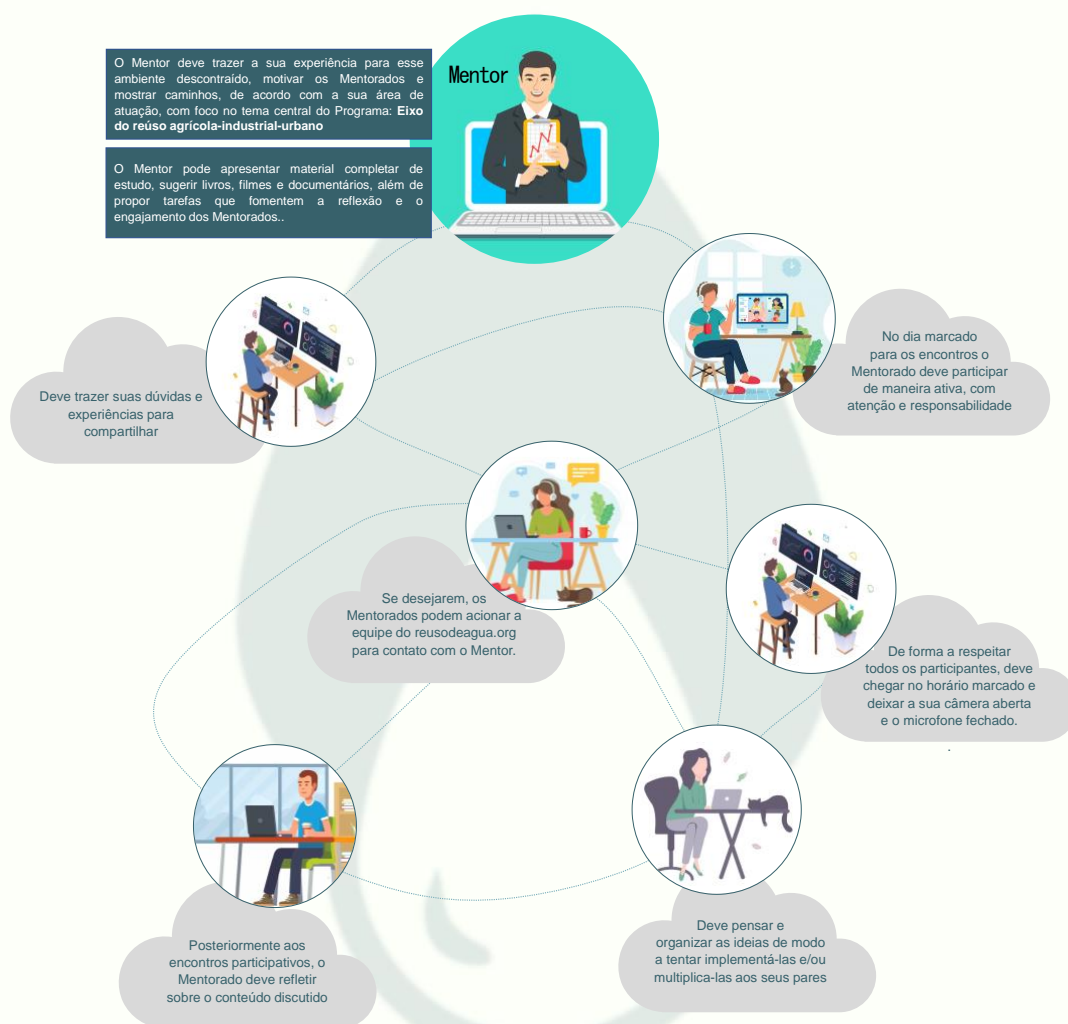
Figura 2. Responsabilidades esperadas para Mentores e Mentorados

A participação ativa (direta e indireta) de todos os envolvidos (Mentores e Mentorados) é fundamental para o sucesso do Programa Mentoria. Veja na Figura 2, as responsabilidades esperadas para cada participante.